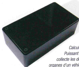
Calculateur X-COM® 3006 Puissant calculateur industriel qui collecte les données depuis les divers organes d'un véhicule

C'est leur mode de fonctionnement. C'est aux Français de s'adapter ». Et d'ailleurs, les Français jouissent d'une assez bonne réputation. Il faudra cependant faire preuve de beaucoup d'humilité pour s'intégrer. « Pour les mettre en confiance, il ne faut surtout pas les brusquer. Il faut agir comme eux... Etaler sa richesse est très mal vu ».